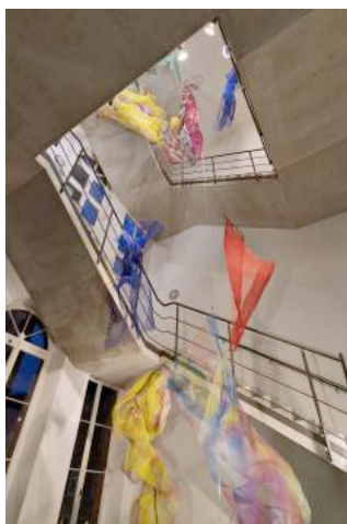
Rachel von Morgenstern »Strip Jack«, 2018 Installationsansicht Kunstverein Hannover

Aus dem eingeladenen Wettbewerb für das Jahr 2018/2019 wurde der Vorschlag der Künstlerin Rachel von Morgenstern angenommen. Die äußerst filigran anmutenden vielfarbigem Skulpturen bestehen aus Vinyl und unterschiedlichen Metallelementen aus Stahl, Aluminium oder Kupfer. Letztere übernehmen im Aufbau der Skulpturen eine stabilisierende Funktion und erwecken darin den Eindruck eine Rückgrats, das umgeben ist von einer membranartigen Gitter- und Netzstruktur, die wiederum die künstlerische Grundlage bietet für eine gattungsübergreifende Vorstellung von Malerei. Mit unterschiedlichen Farben koloriert, offenbart sich für die Betrachter*innen eine faszinierende Gleichzeitigkeit von Malerei und Skulptur, von Transparenz und Körperlichkeit, von Enthüllung und Verhüllung.